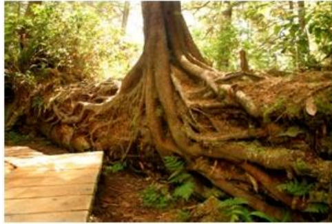
Figure 1. Nurse log in Esowista Indian Reserve 3, British Columbia.

The nurse log (see Figure 1) is a common feature of Pacific Coast temperate rainforest ecosystems, where the damp environment and rich nutrients of decaying trees provide ideal condition for growing coniferous seedlings